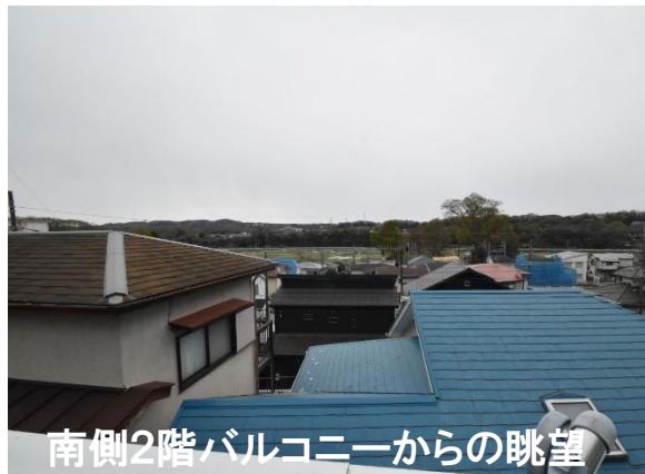
南側2階バルコニーからの眺望