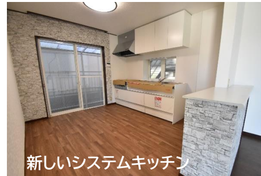
新しいシステムキッチン