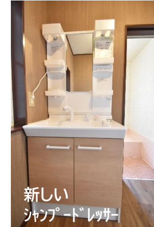
新しいシャフトレジャー