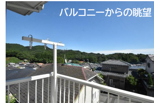
バルコニーからの眺望