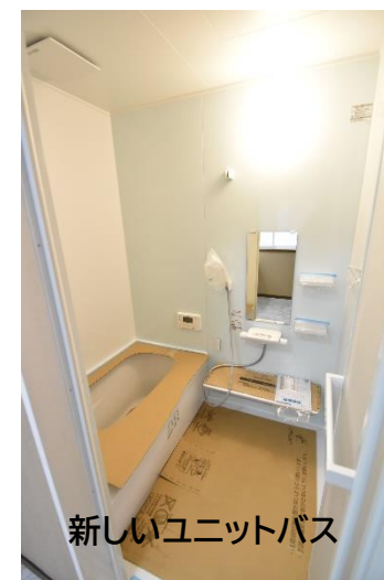
新しいユニットバス