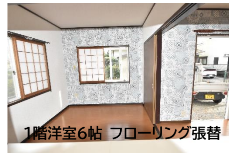
1階洋室6帖 フローリング張替