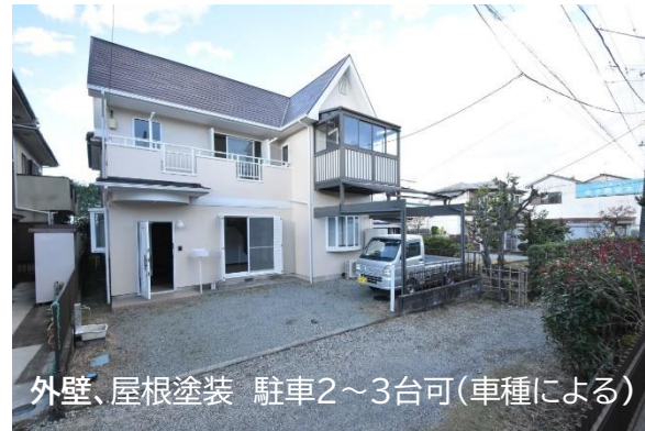
外壁、屋根塗装 駐車2~3台可(車種による)