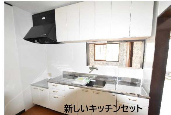
新しいキッチンセット