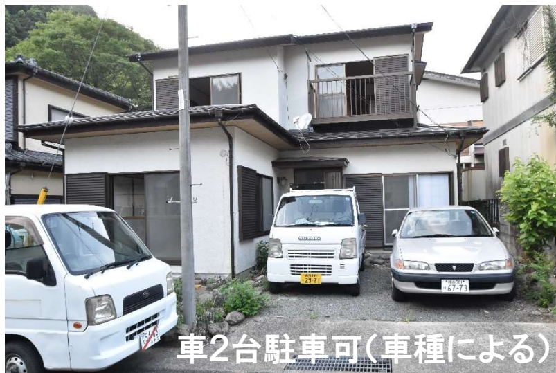
車2台駐車可(車種による)